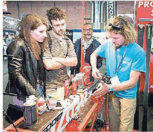
Uno skiman mette a punto con la sciolina uno sci