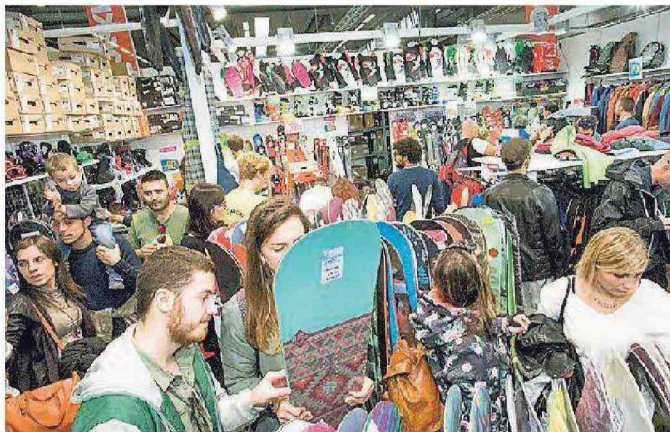
Ressa tra gli stand per scoprire le nuove attrezzature per la neve