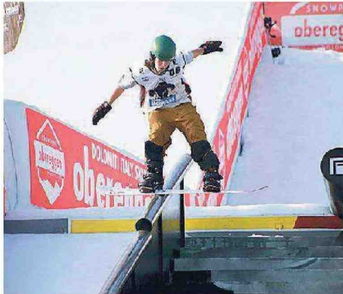
Snowboarder in azione