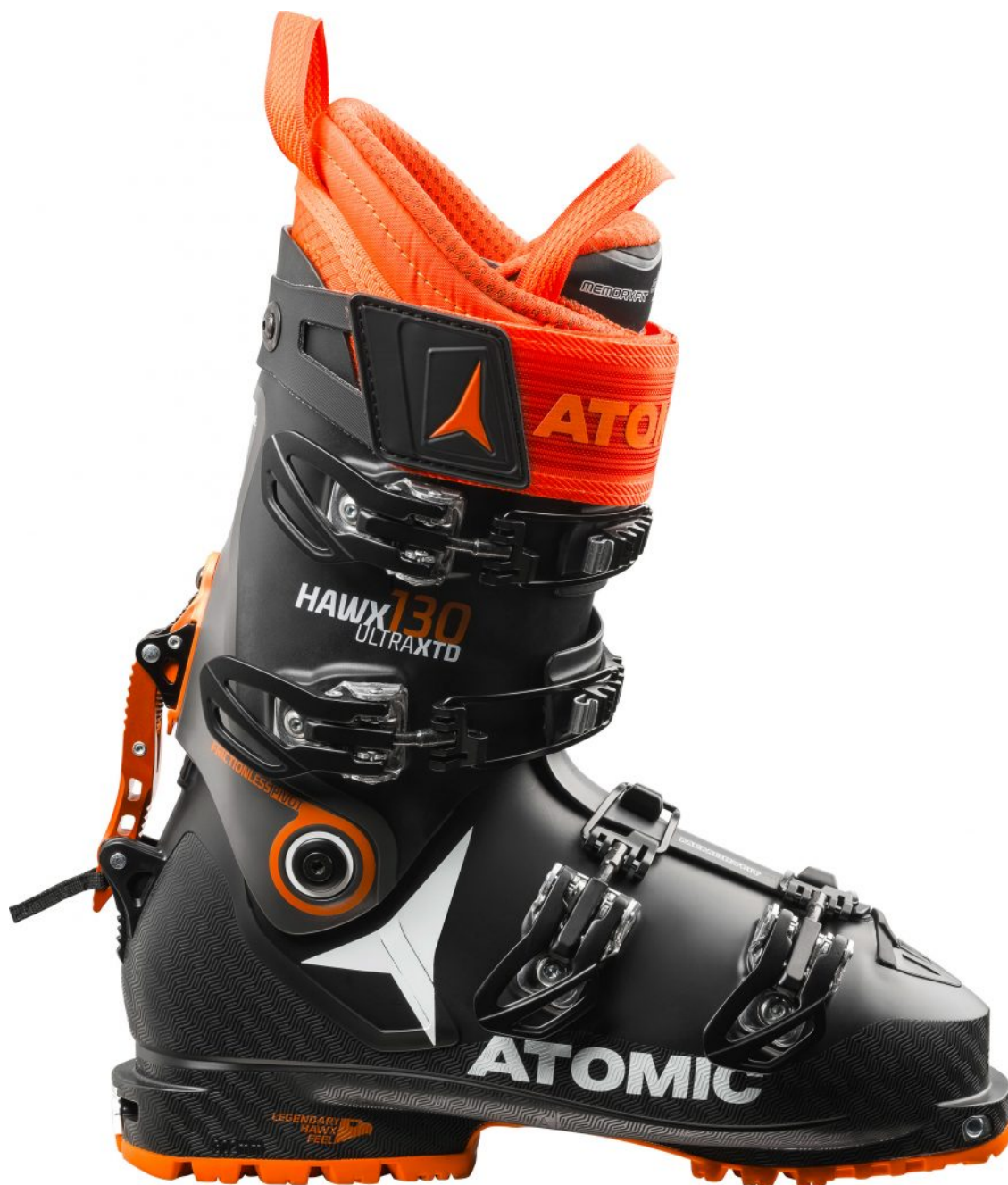
Il modello Hawx Ultra XTD 130 di Atomic. Per sciatori che non vogliono scegliere tra pista e fuoripista

Scegliere di non scegliere è un diritto per gli sciatori amanti dell'all-mountain. Per eliminare qualsiasi dubbio occorre orientarsi su un paio di sci con struttura soft e raggi di curva medi. Come gli sci XDR di Salomon, che presentano grandi doti in termini di versatilità. La struttura è leggera grazie alla tecnologia C/FX che presenta la fibra di lino artificiale sulle estremità. Stabile e robusta. Il nucleo è invece realizzato in legno e titanio, per un miglior controllo quando si disegna una curva. Il modello XDR 84 Ti – dove 84 sono i mm al centro – è adatto sia alla neve fresca che a quella compatta o insidiosa. In vendita, equipaggiati con attacco Warden 13, a 849 euro.