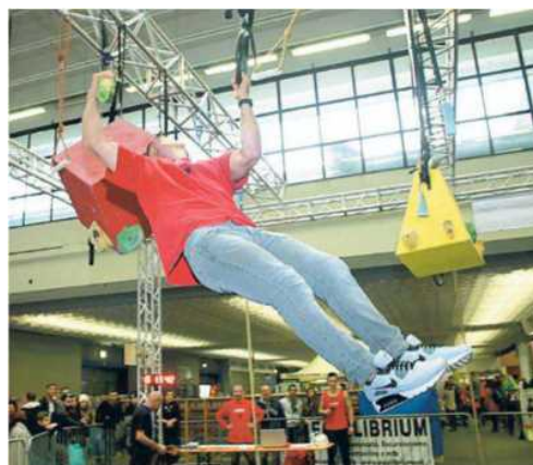
Visitatore impegnato nella palestra di arrampicata