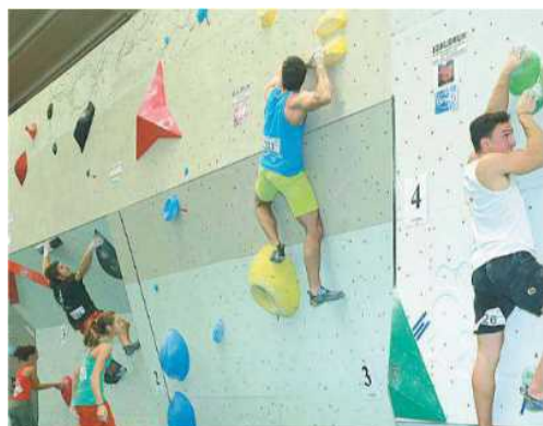
Il torneo di free climbing