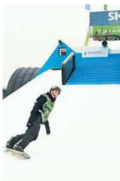
Snowboarder in azione