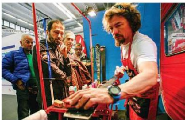
La preparazione degli sci affidata alle mani di un esperto

no anche frutto delle importanti collaborazioni attivate dall'Ente Parchi Emilia Centrale con la UISP, il CSI, la FISI e le Associazioni locali. Tutti eventi che costituiscono un'opportunità per conoscere ed apprezzare ulteriori aspetti del territorio, in primo luogo i prodotti tipici, grazie all'offerta di hotel, ristoranti e servizi convenzionati. Sul palco Main Events prosegue il programma denso di eventi della Federazione italiana sport invernali che, dopo aver premiato le categorie giovani e gli sci club che hanno raggiunto i 50 anni, si prepara alla consegna oggi del Cristallo d'Oro.