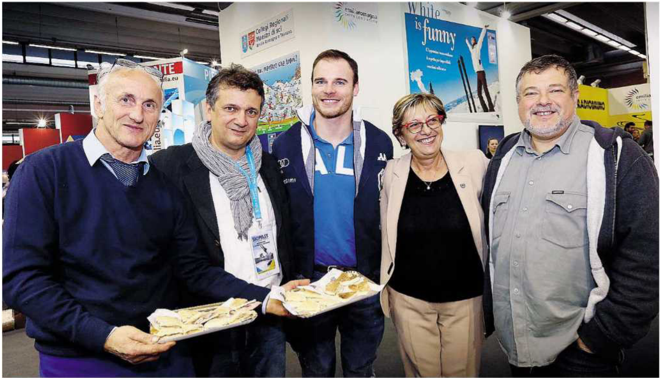
MODENA Al centro il campione Giuliano Razzoli