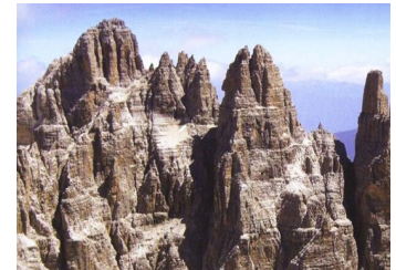
A scuola dai Maestri tra Dolomiti e Patagonia