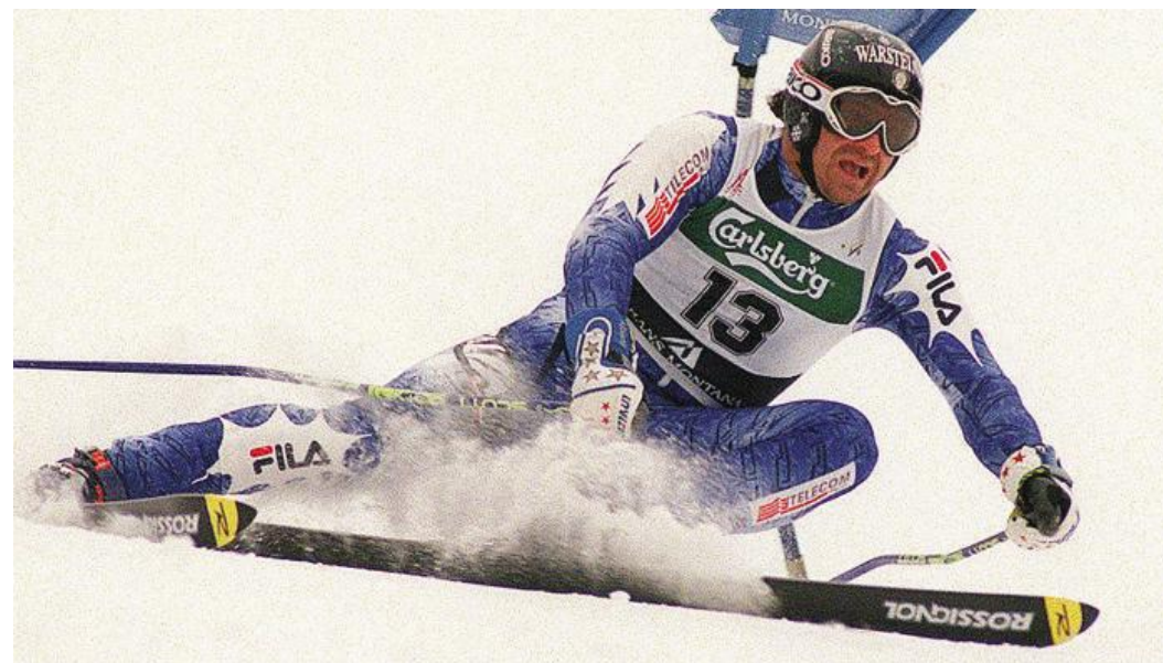
Alberto Tomba (immagine d'archivio)