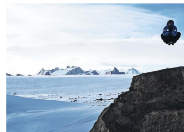
Andy Kirkpatrick "Sono un alpinista tutto da ridere"

Ma Skipass non è solo sci agonistico, è anche spettacolo business e politica sportiva. A tener alta la bandiera dello spettacolo ci ha pensato Valerio Staffelli, inviato di Striscia la Notizia , inseguito da gruppetti di ragazzini alla ricerca dell'autografo. Amante della montagna, Staffelli è stato un ex agonista: «Amo la montagna, lo sci mi rende libero». Per quanto riguarda la politica sportiva, da sottolineare la presenza del presidente della federazione internazionale Gianfranco Kasper - e questo è un punto di merito per la federazione e per gli organizzatori. Venerdì, il secondo capitolo. Skipass è un laboratorio continuo: si parlerà di alpinismo, di materiali e del futuro della montagna. La fiera è entrata nel vivo.