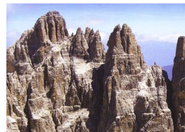
A scuola dai Maestri tra Dolomiti e Patagonia