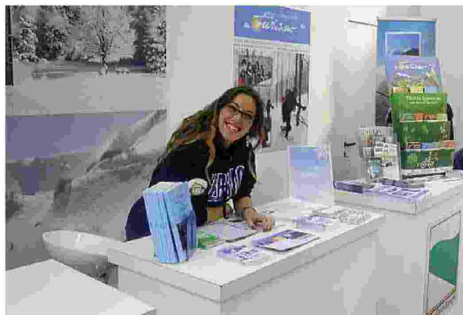
Lo stand della stazione sciistica di Febbio a Skipass